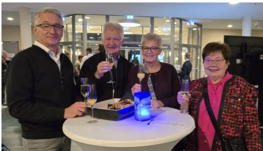
Vertretung unserer PingPongParkinson-Gruppe am Ehrenabend in Veitshöchheim

Unter den nominierten Initiativen befand sich auch unsere PingPongParkinson-Gruppe. Leider wurde diese von der Jury nicht für einen Förderpreis ausgewählt. Trotzdem können wir stolz und dankbar sein für das große ehrenamtliche Engagement, das in unserem Verein geleistet wird, und freuen uns, damit zu einem besseren Gemeinwohl beitragen zu können!