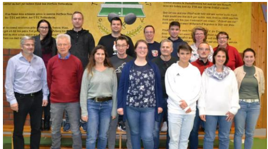
(Vorstandschafft 2023/26 mit ausgeschiedenen Mitgliedern)